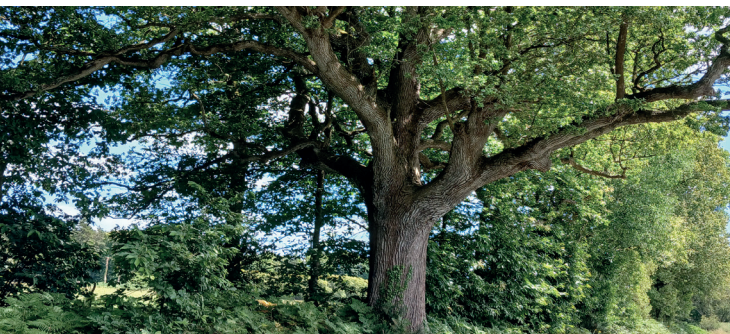
Le Chêne de la Motte

Construite en 1609 par la volonté des habitants du hameau, la chapelle de Bénin est dédiée à St Yves , dont le pardon est célébré en mai. Faite en pisé, elle fut restaurée à maintes reprises. Sur le placître qui servit de cimetière, se dresse une croix du XV e ou XVI e siècle, au fût octogonal se terminant par l'image du Christ. La pierre subit les affres du temps puisqu'un bras est confiné dans un cercle d'acier, et que les armoiries figurant sur le socle sont effacées. A l'intérieur, l'autel possède un très beau retable du XVII e siècle qui proviendrait de l'ancienne église paroissiale. On y trouve deux niches contenant les statues de bois de St Yves et de St Jean-Baptiste . Le fronton abrite la Vierge à l'enfant , encadrée de deux petits anges .