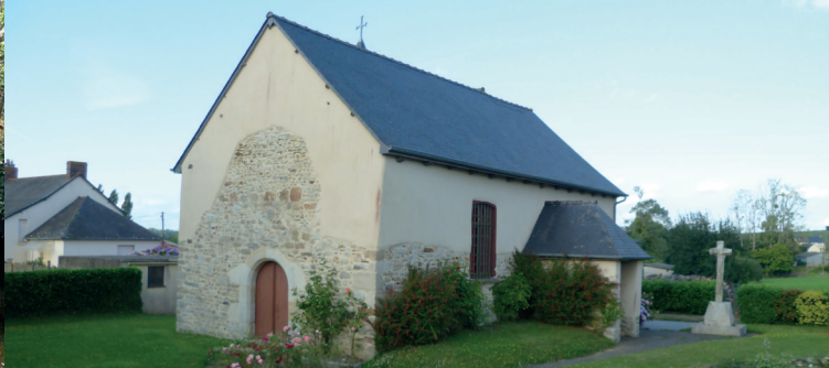
La chapelle de Bénin